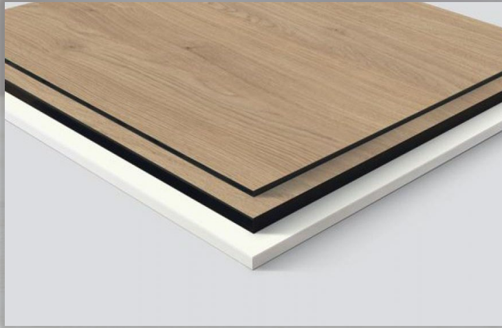
CPL AND COMPACT LAMINATES اللامينيت