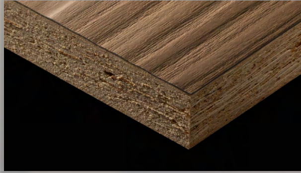
MFC [MELAMINE FACED CHIPBOARDS] شيببورد الميلامين

تقدم شركة WPC مجموعة واسعة من الأخشاب المعالجة عالية الجودة المستوردة من إيطاليا وتركيا وألمانيا ومنتجات بتقنيته عالية من الصين. بعض المنتجات المتوفرة هي: