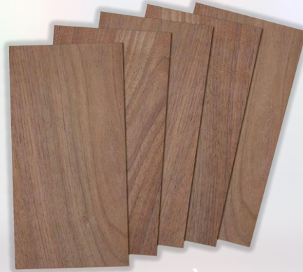
SINGLE FACED MELAMINE MDF لوح ميلامين MDF على وجه واحد