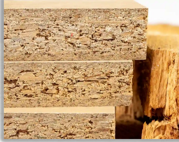
CORE CHIPBOARD الواح الشيببورد