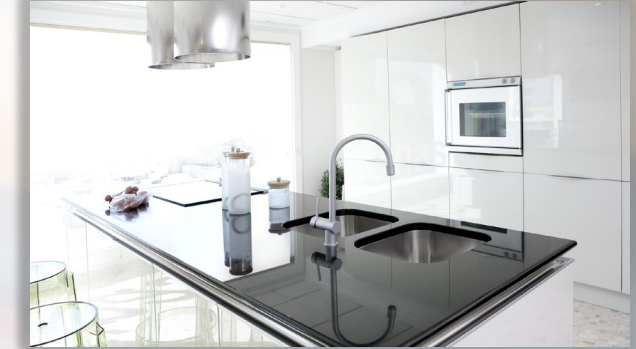
EB & NANOTECHNOLOGY SURFACES تقنية النانو وشعاع الإلكترونات